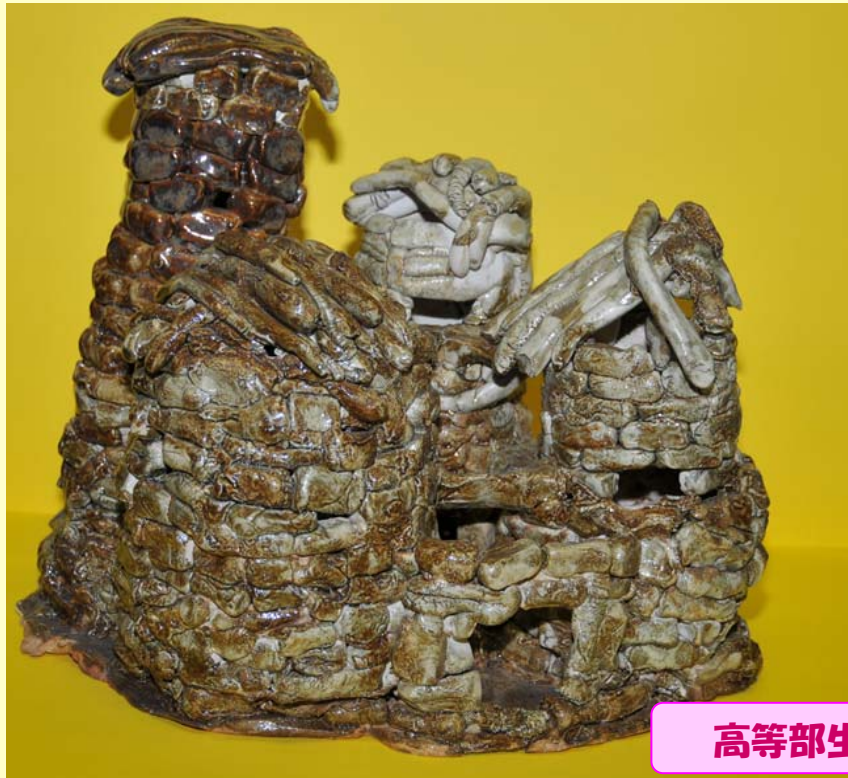
高等部生徒作品「石の城」