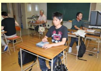
プレクストークによる学習