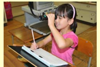
弱視レンズによる学習