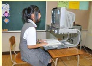
拡大読書器による学習