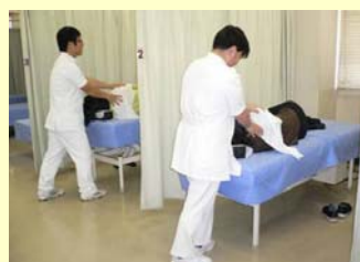
あん摩マッサージ指圧