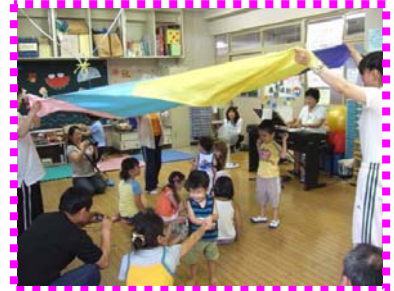
乳幼児親子教室 「音楽遊び」の様子