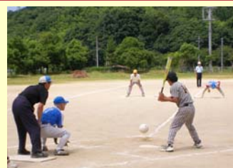
グラウンドソフトボール