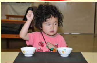
幼稚部・手指学習