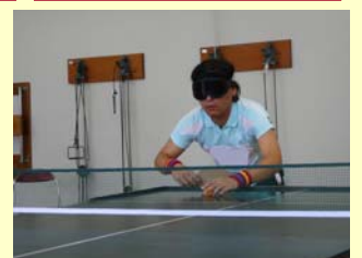
サウンドテーブルテニス