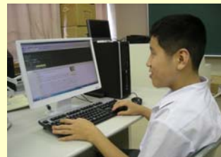
音声パソコンによる学習