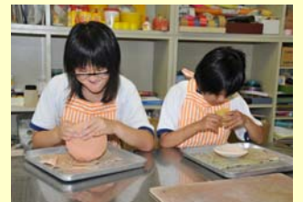
高等部・作業学習